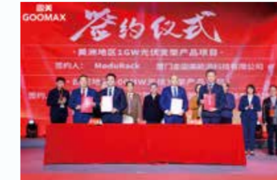
活动中，固美和菲律宾“ONESKY”签约，合作投建年产10万吨的高品质铝材厂；与中国电信南安分公司签约，建设行业省内首家5G全连接工厂；与美洲地区客户代表、台湾地区客户代表签约，金固美

南安市人民政府副市长邱雪亮致辞，对固美创立30周年表示热烈祝贺，充分肯定了固美在南安制造中起到的“脊梁”作用，以及在实现自身发展的同时，坚决扛起企业社会责任，为南安经济社会发展作出的重要贡献。