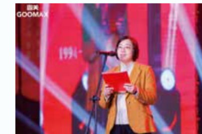
南安市人民政府副市长邱雪亮

南安市人民政府副市长邱雪亮致辞，对固美创立30周年表示热烈祝贺，充分肯定了固美在南安制造中起到的“脊梁”作用，以及在实现自身发展的同时，坚决扛起企业社会责任，为南安经济社会发展作出的重要贡献。