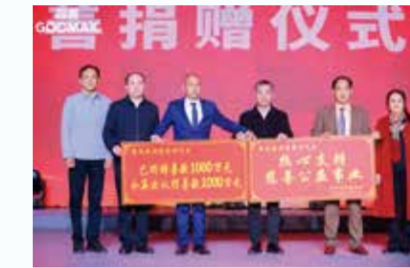
南安市委书记张桂森（右三）

将迎来新的飞速发展。此次战略合作协议签署，固美将强力推动企业数字化升级，加速海外市场发展布局，进一步提升市场竞争力和社会影响力。